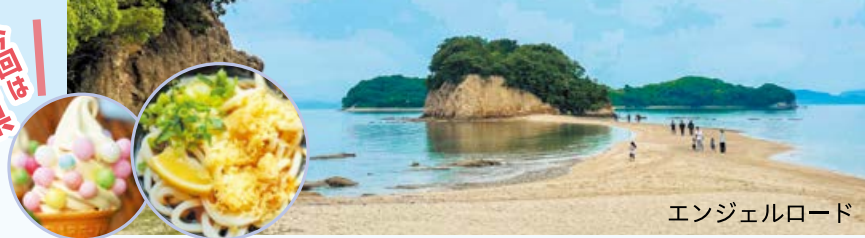
エンジェルロード