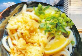
瀬戸大橋記念公園